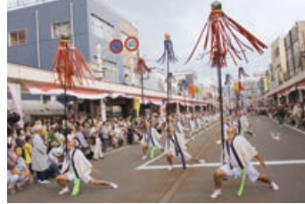
△平成26年おぢやまつりの様子

高梨と五辺町内に江戸時代後期から伝わり、町内総出で130人も行列が、江戸時代の装束で練り歩く大名行列です。五辺にある神明社は伊勢神宮の神を祀り、その御札が伊勢から来るときに行列を組んで迎えていたのが始まりと言われています。8月25日(日)には、平成26年のおぢやまつり以来、10年ぶりに本町で披露されます。