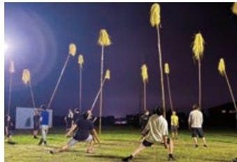
△7月上旬の練習の様子

行いました。7月中旬からの練習で使用している本物の羽連には一つ一つ個性があり、手作業で組み立てます。重い羽連を片手で持ちながら独特の姿勢で振るため、非常にバランスがとりにくく、本番までは何度も練習を重ねていきます。