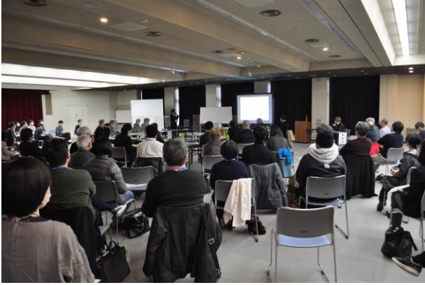
3月13日(土) 第二次審査の様相 会場：総合産業会館サンプラザ