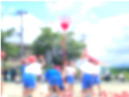
チェッコリダンス付き玉入れ