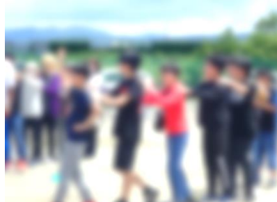
中学生も大勢参加! ありがとう