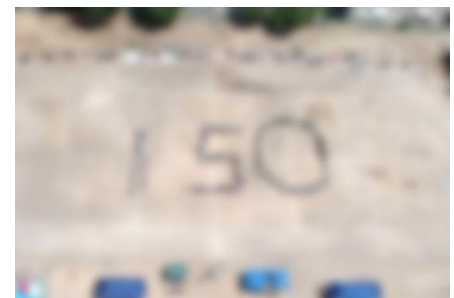
みんなで作り上げた150の数字