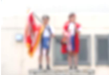
2人の6年生。本当によく頑張った!