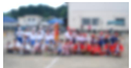
得点による勝敗はあれど、正々堂々戦う姿に優劣はありませんでした