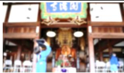
5/10 校区探検 1・2年生が吉谷小の開学の地「圓滿寺」を訪問しました。

★日常生活の様子や給食メニューをホームページで毎日紹介しています。ぜひご覧ください。