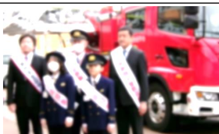
4/4 1日消防署長体験 6年生2名が堂々と務めました。はしご車にも乗りました。