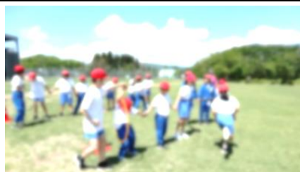
5/2 全校遠足 おちゃ〜るまで全員完歩し、たくさん遊んできました。