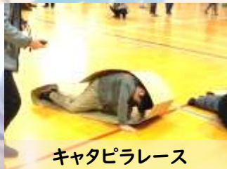
キャタピラレース