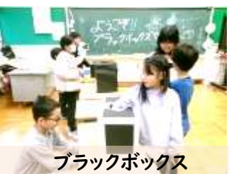
ブラックボックス