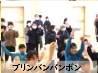
グリーンバンバンボン