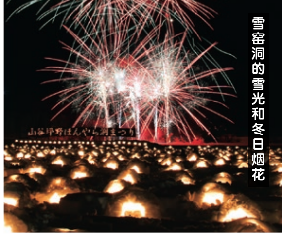
雪窑洞的雪光和冬日烟花