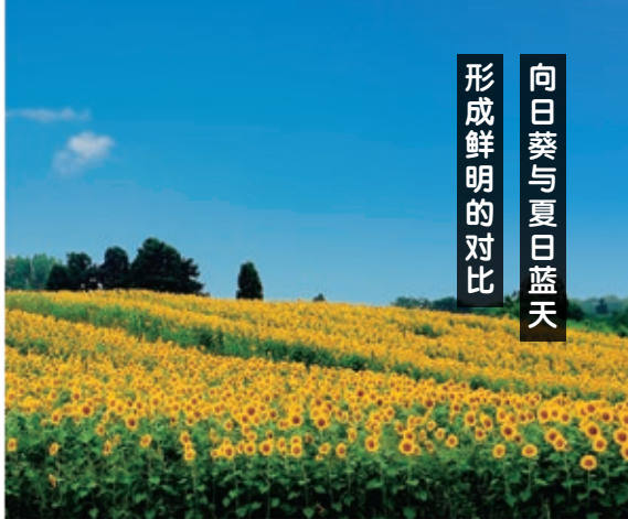
山本山高原的向日葵畑 MAP C-4