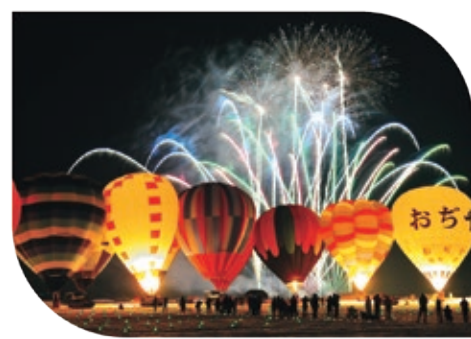
映照夜空的发光的气球

皑皑雪原上飘着许多五彩缤纷的热气球，冬日风物诗。每年2月下旬举办为期两天的“小千谷气球狂欢节”。第一天的晚上，进行气球和烟花的竞赛表演。这个令人幻想的世界值得一看！