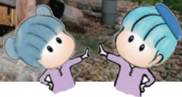
温泉胜地 缩里 吉祥物 皱缬妹 捻线绸君