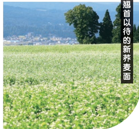
外之泽的棚田 MAP C-5