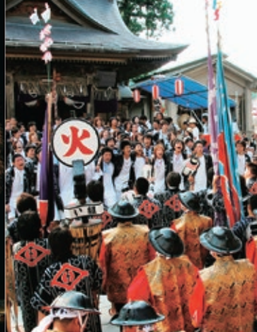
浅原神社 / 片贝烟花会场 MAP B-1