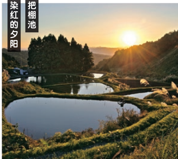
东山地区的养鲤池 MAP D-2