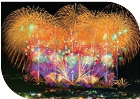
烟花的压轴戏是宽度 1,000 米以上的超大型版！

小千谷祭是每年 8 月下旬盛大举办的小千谷市最大的祭礼。连同“大型烟花大会”和“全体市民参加的盂兰盆会舞蹈”，“活动万灯盛装游行”也是不可不观赏的！各街道居民会、市民团体创作的，带有特殊装置的巨大的万灯随着伴奏的音色和号子声在街道中盛装游行。