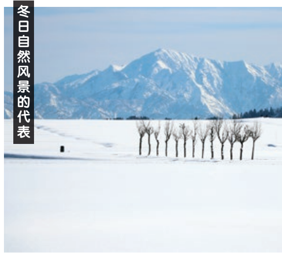
冬日自然风景的代表