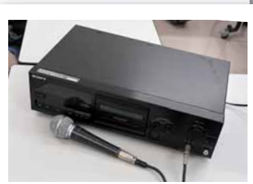
△専用のカセットデッキで録音を行います。

—やってみてよかったです何ですか 自分のできることで、少しでも誰かの役に立てれば、という気持ちで続けてきました。年に2回、聞き手の方との交流会も行っていて、そういった関わりも楽しいです。また、声を出して読むと気持ちが良く、若返るような気がします。