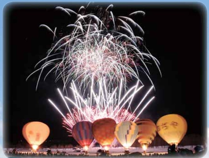
△グローバルーンフェスティバル