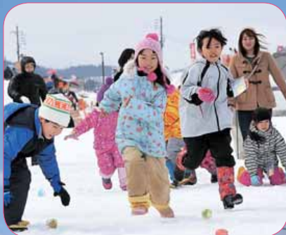
△子ども向け宝探し

雪原イベントの会場となった信濃川河川公園では、うまいもの広場やグローバルーンなど多彩なイベントで賑わっていました。西中会場では天候不良のため一部の熱気球競技フライトが中止となりましたが、25日の午後には貴重な晴れ間が見られ、40機の熱気球が小千谷の空へ舞い上がりました。