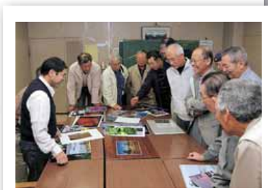
△撮影指導の様子。楽しそうな笑顔が多く見られました。

自分たちで撮影した写真を持ち寄り、会員同士で品評し合ったり、指導者から撮影指導を受けたりしてお互いに写真の腕を高め合っています。