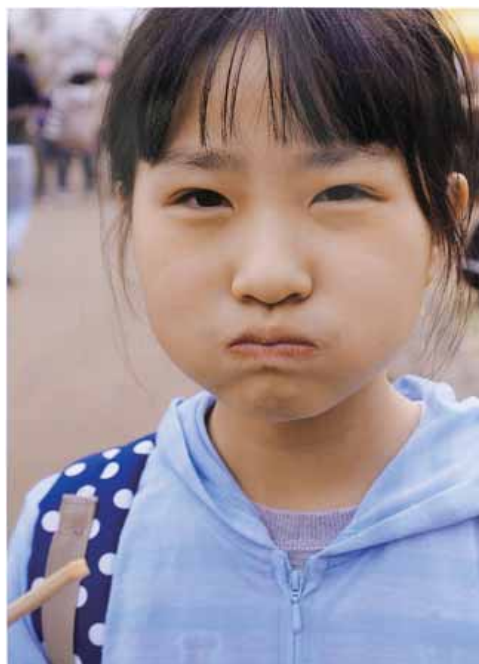
△写真の部／中俣綾乃さんの作品 『もぐもぐ』