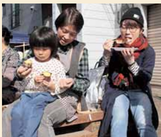
△まつと秋の陣 (真人)