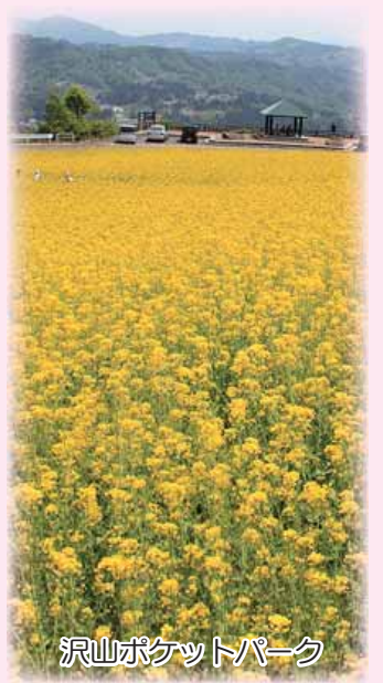
沢山ポケットパーク