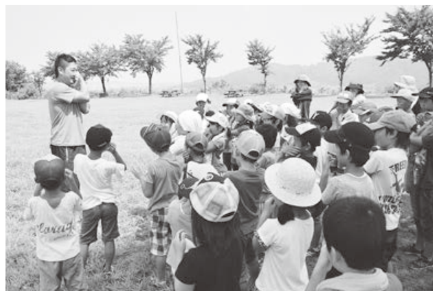
夏休みお楽しみ会（公民館東小千谷分館）

青少年の育成活動を行うPTAや地域団体などに対し適切な指導を行うため、青少年育成指導者の養成と資質の向上を図り、地域や家庭の教育力の向上に努めます。