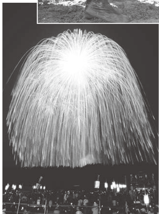
四尺玉（片貝まつり）