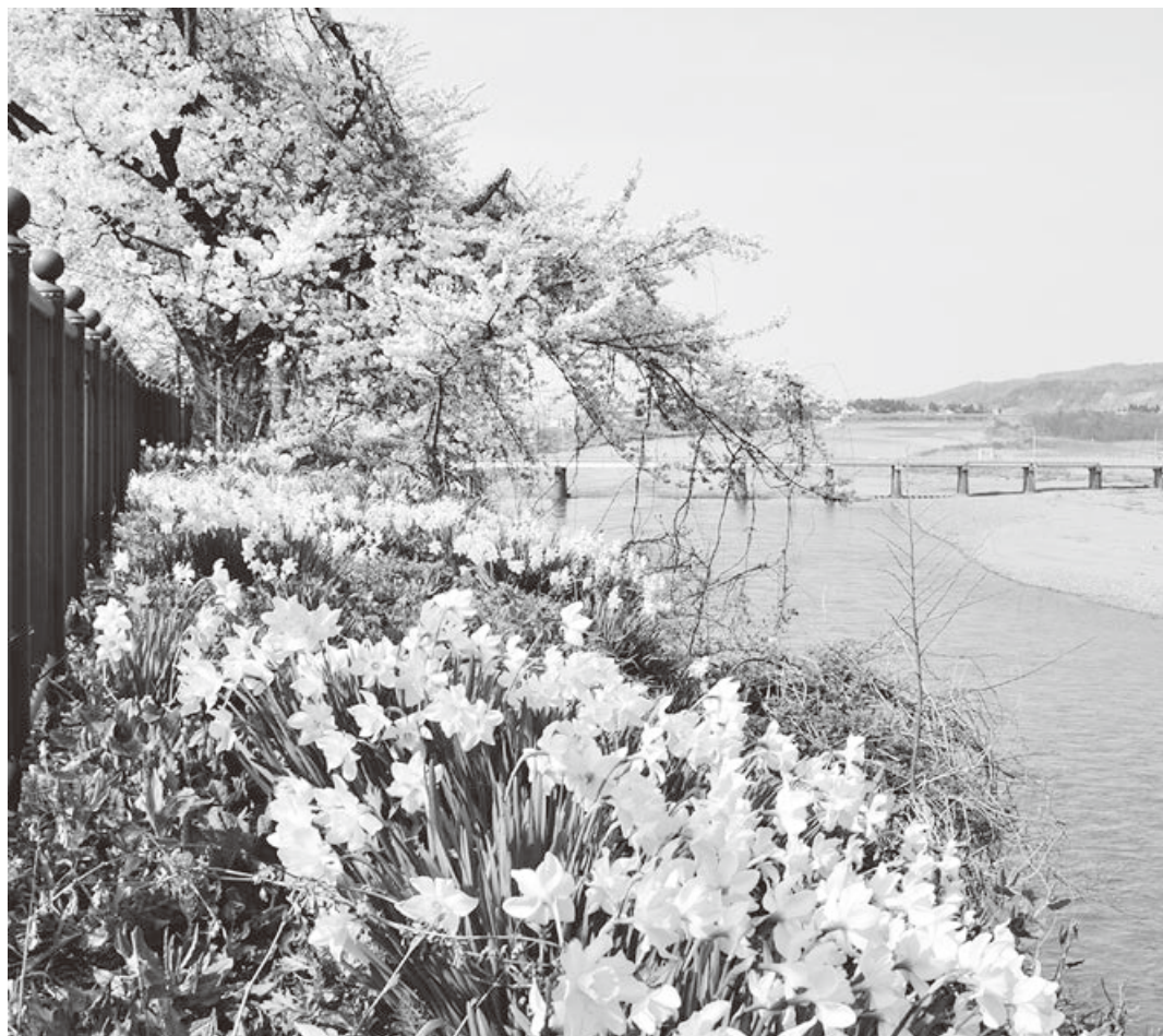
市花すいせんと信濃川