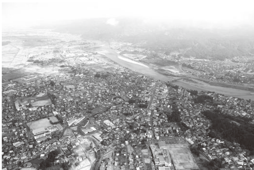
上空から見た小千谷市

計画的な土地利用と社会資本の円滑な整備を促進するため、計画的かつ効率的に国土調査を推進します。