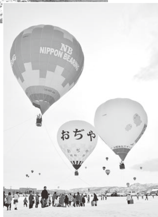
熱気球試乗体験（おぢや風船一揆）