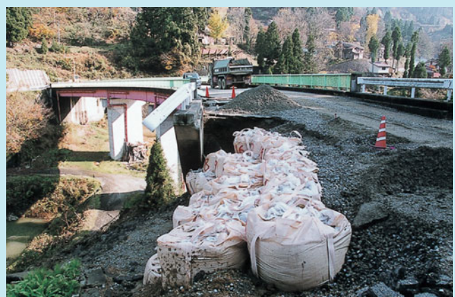
橋のたもとがくずれ落ちた蘭木トンネル