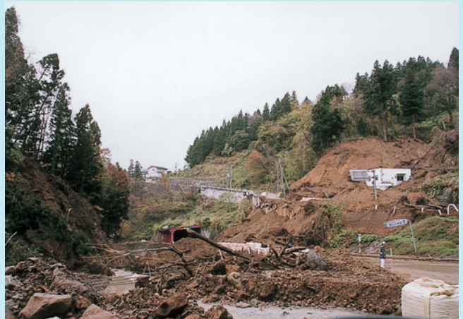
土砂であふれる東山トンネルと道路