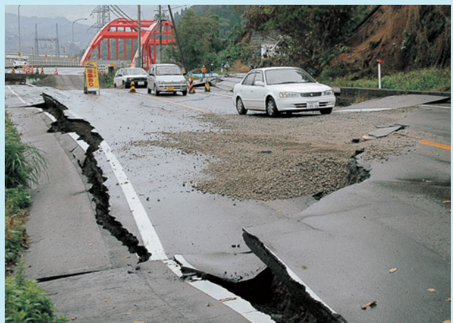
道路に段差とひび割れができた山辺橋付近