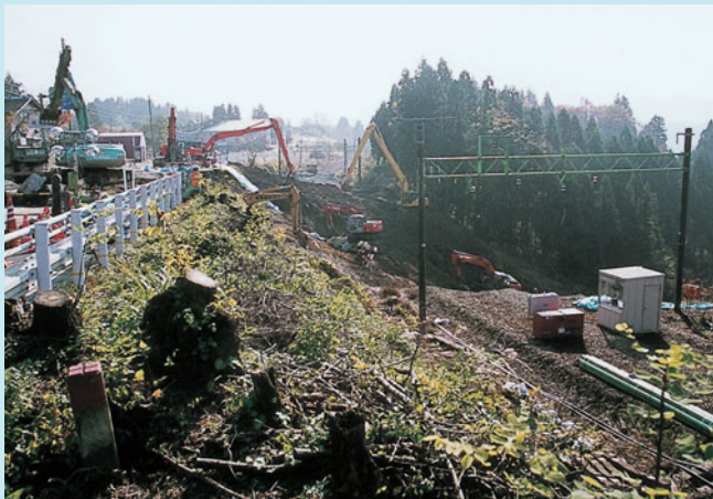
線路が見えないほどの被害があった上越線 (小千谷ー川口間)