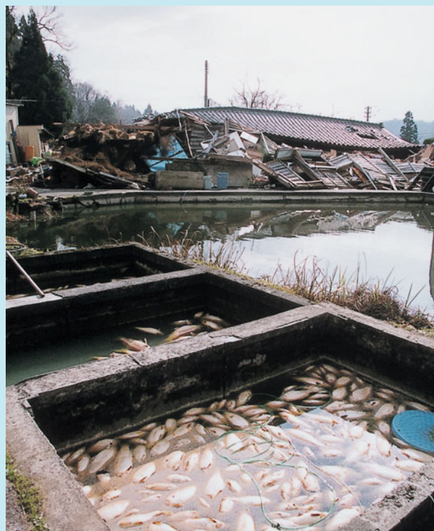
倒壊した家屋と死んだ錦鯉 (塩谷)