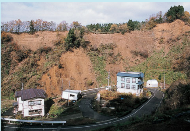
崖崩れによりあたりが一変した首沢付近