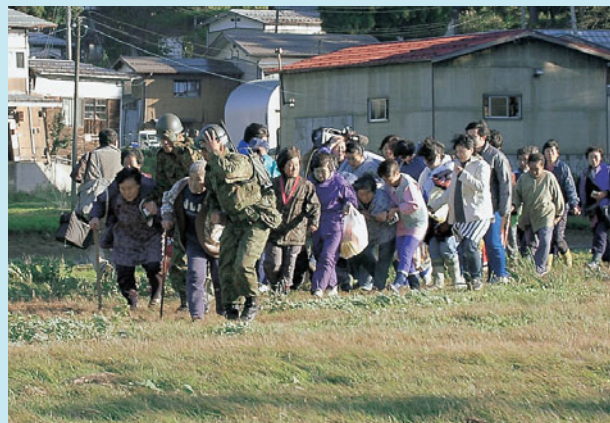
自衛隊のヘリで救助される人たち (塩谷)