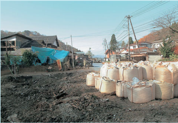
土のうが積まれた浦柄