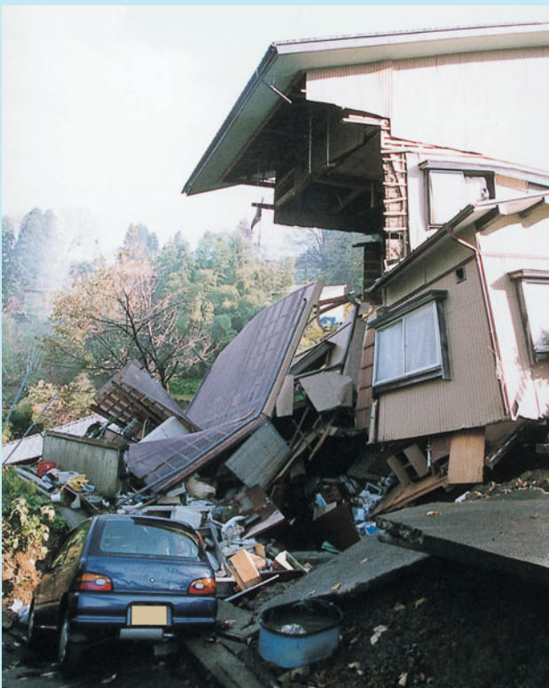
家財が飛び出した家（中山）