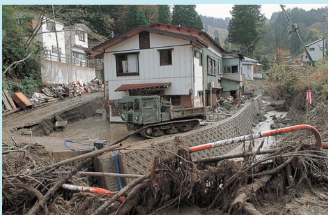
川があふれ泥がたまった荷頃