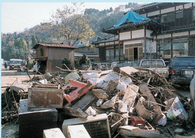
泥まみれになった家具類 (浦柄)