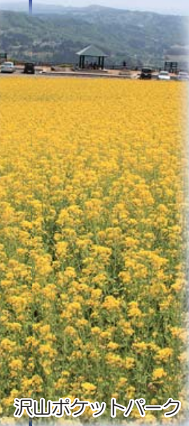
沢山ポケットパーク