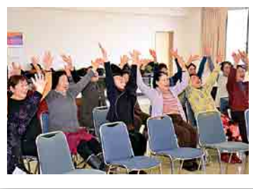
△みなさんイキイキと講座を受けていました

市内在住の60〜84歳の方が在籍していて人数も多いので、おぜいの方と接することができ、