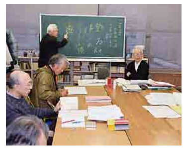
△みんなで知恵を出し合いながら解説を進めます

江戸時代末期に小千谷の寺院で書かれた、民の約束事が記された古文書の解説が行われていました。その内容はというと、「夫婦、兄弟は仲睦まじく」「大酒を飲むな」、「仕事をしっかり勤めなさい」などなど。文明は発展し生活は劇的に変わりましたが、「人」は今も昔も相変わらずなのだと思います。苦笑いしてしまいました。