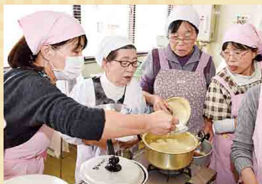
△岩沢のごつつおを調理する小千谷市食生活改善推進委員と岩沢まごころ市のみなさん

和食は、低脂肪で食物繊維やカルシウムがたっぷり摂れますが、塩分が気になるところです。減塩でおいしく食べるには、酢、昆布やかつおぶしなどで取っただしを使いましょう。