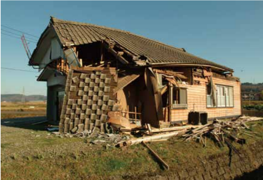
倒壊する吉谷公民館(滝谷)