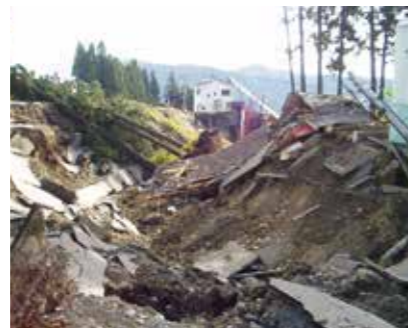
地盤が崩壊した水道施設(卯ノ木)