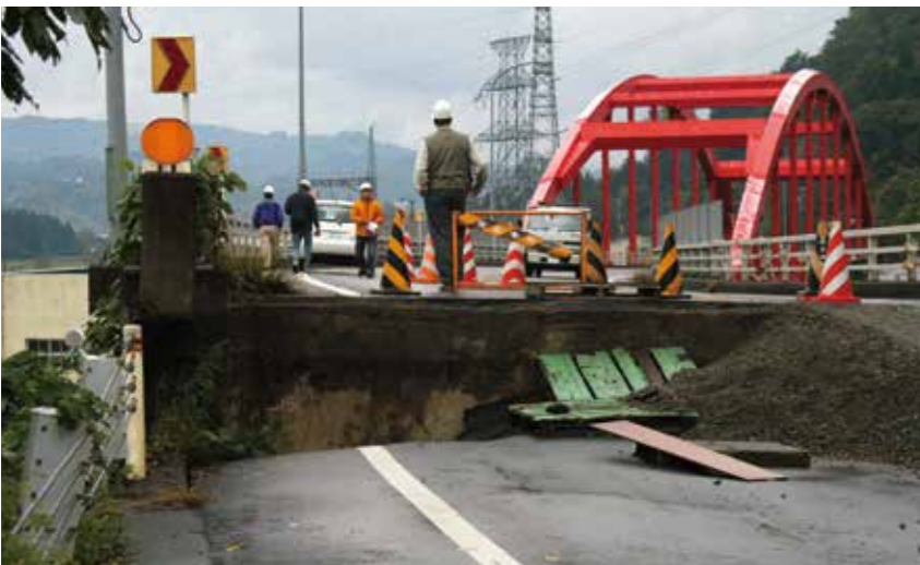
大きな段差ができた山辺橋付近の国道117号