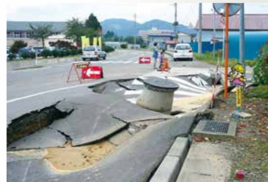
浮き上がるマンホール(千谷)