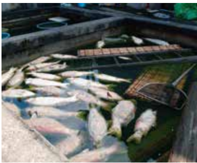
養鯉施設で死んだ錦鯉