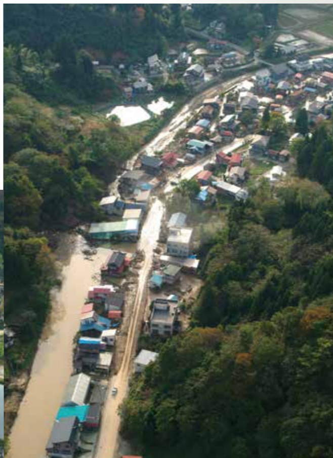
水に浸かった浦柄町内