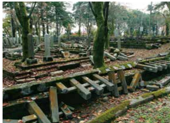
倒れた船岡公園の西軍墓地