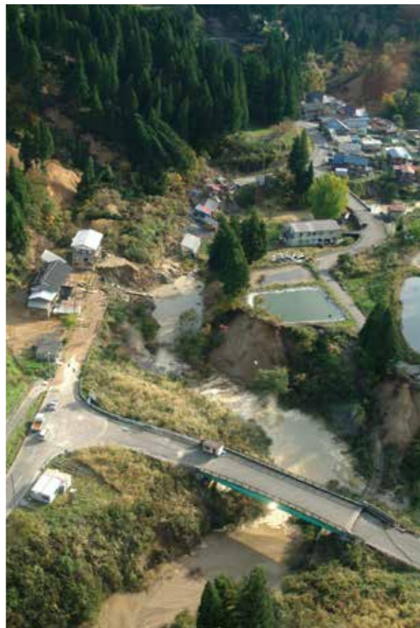
土砂が崩落し孤立した十二平町内