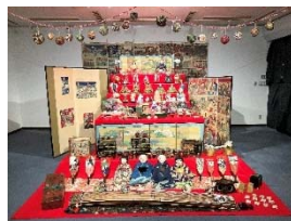
西脇本家雛人形群