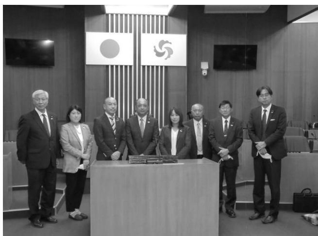
総務文教委員会行政視察