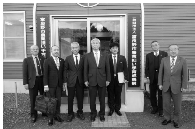
民生産業委員会行政視察