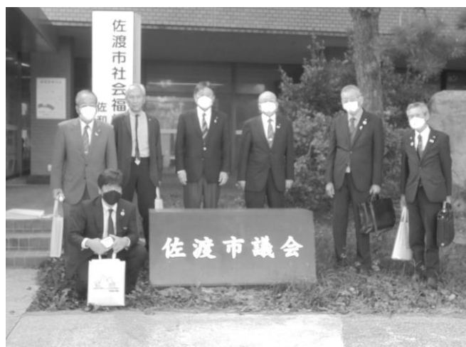
民生産業委員会行政視察