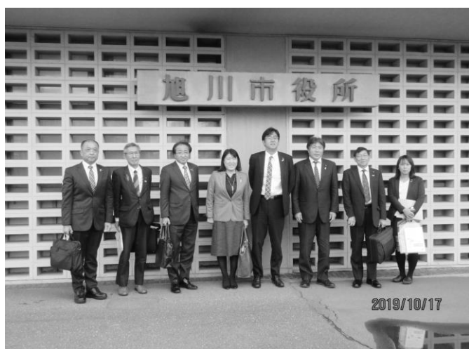
総務文教委員会行政視察