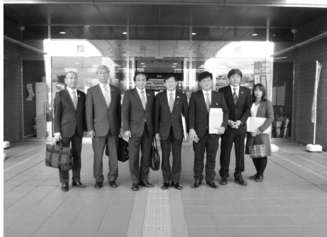
議会運営委員会行政視察