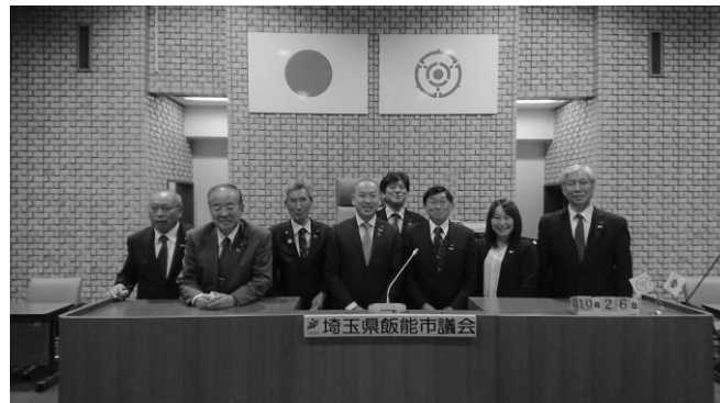
議会運営委員会行政視察