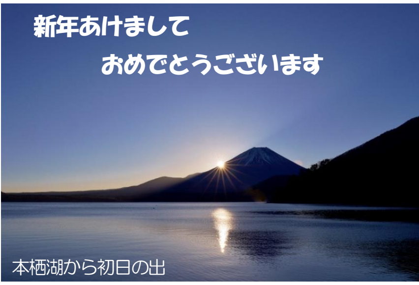
本栖湖から初日の出

ご家族お揃いで穏やかに新年を迎えられたことと存じます。昨年は能登半島地震等の大きな災害がありました。今年は当地が大きな災害に見舞われることのないように願うものです。4月からは芋坂町内と時之島町内が一緒になり新しく「芋時町内」が誕生します。ますます新しい町内が活気づくことと存じます。