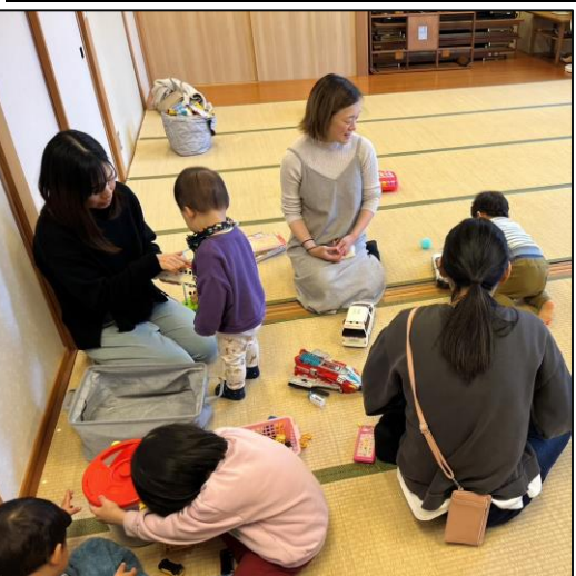
昨年は移住の方との交流も