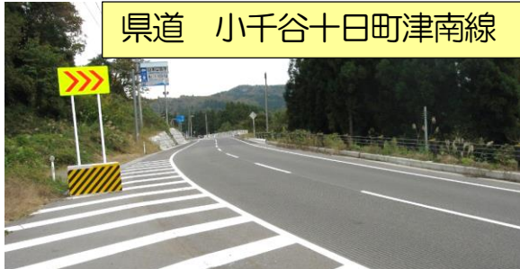
県道 小千谷十日町津南線

さて、当協議会では各町内の要望事項を取りまとめ、行政と連絡をとりながら少しずつではありますが改良、改善に努めています。各町内の具体例についてはそれぞれの町内会長にお聞きください。地域及び町内の要望事項は多岐に渡る所ですが、進展してゆくように努めて行きます。