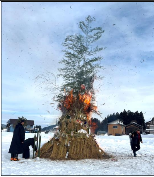
右 上沢町内 丸山知子氏提供 左 若柘町内 細金 靖氏提供

1月12日(日)を中心に真人町各地の小正月の伝統行事となる塞ノ神が実施をされ、無病息災が祈念されました。今年一年の防災や疫病、家内安全、五穀豊穡、商売繁盛などご利益があり、良い年となるように行事が進められておりました。