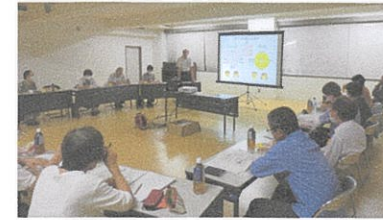
定例会の様子 9月2日

1年目は何もわからず参加し、地域でも何の問題もなく、ほとんど発言もせず勉強の年でした。2年目・3年目は、自分で出来る事は、やろうと思いついて進めてきました。2期目になると、他地区の定例会はどんな事をしているのだろう?と気になり「参加してみたいな」と思うようになりました。しかしその機会もなく、知っている方に聞いてみたりしました。日中に定例会をやっている地区は、他の施設に出かけて行って見学をしたり、お話を聞いたりにしてました。又、小学校の給食参観もしている地区もあるようです。第一地区でも市外研修もありましたが、コロナ禍からそれも無くなり少し淋しいような気がします。他地区では、いつも役員さんが研修内容を決め、会を進めているとも聞きました。第一地区のように月の当番になると、内容を決めたり、当日は進行役でもあり大変ですが、勉強になり良い経験になっています。今後も定例会はもちろん、研修会にも参加して、これからも研鑽を積んでいきたいと思っています。