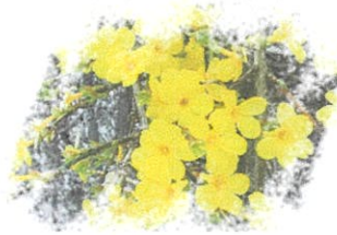
黄梅花 別名 [迎春花]

5月半ば頃になると、我が家の庭にはスイセン・チューリップ・椿と共に、黄色の粒状の花が咲く。これが黄梅花だ。7～8年前ころ、市社協の「心配ごと相談員」の研修会で、埼玉県北本市で勉強後、川越市にある県工業試験場に立ち寄った。玄関先に「黄梅花の種、ご自由にお持ち下さい」とあり、20粒程頂戴し、翌年春に播いたものである。黄梅花はつぼみが小さいが可憐な花で、時期になると、「この辺にないきれいな花だね」『素敵!』と近所の声。私はその度に講釈するが、確かにこの地方には見られない花だと自負している。種が採れたら、希望者に分けてやりたいと考えている。