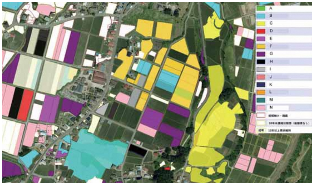
現状地図に話し合いを反映した目標地図の素案