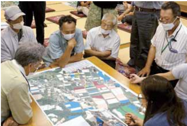
将来の受け手について検討している様子

真人里地地域では、新潟県、ビレッジプラン実践事業に取り組んでいます。農業情勢が一層厳しさを増すなか、中山間地域の営農継続や集落機能の維持のため、地域の将来プランの策定に向けた話し合いを行ってまいりました。また、活動の主体となる組織作りや取組をサポートできる人材の養成も含め、これらの取組の実践について県・市・農業委員会等の関係機関も伴走型サポートを行っています。実践プランの主な内容は、①地域農業継続への取組、②笑顔で楽しんでいるまちづくり、③活力ある地域づくりがあります。 高齢者などから、冬期間の市街地への買い物は大変との意見があり、