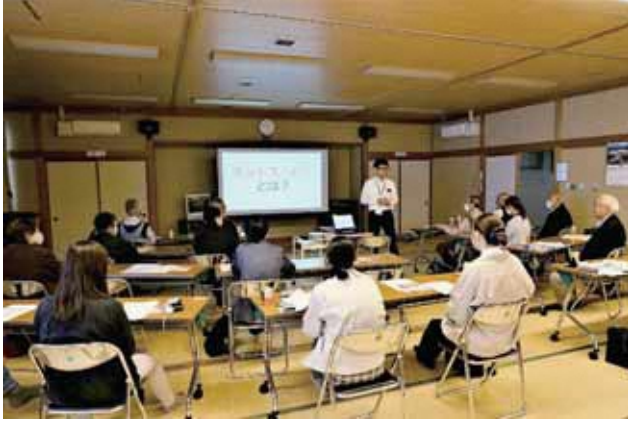
ネットスーパー勉強会の開催

真人里地地域では、新潟県、ビレッジプラン実践事業に取り組んでいます。農業情勢が一層厳しさを増すなか、中山間地域の営農継続や集落機能の維持のため、地域の将来プランの策定に向けた話し合いを行ってまいりました。また、活動の主体となる組織作りや取組をサポートできる人材の養成も含め、これらの取組の実践について県・市・農業委員会等の関係機関も伴走型サポートを行っています。実践プランの主な内容は、①地域農業継続への取組、②笑顔で楽しんでいるまちづくり、③活力ある地域づくりがあります。 高齢者などから、冬期間の市街地への買い物は大変との意見があり、