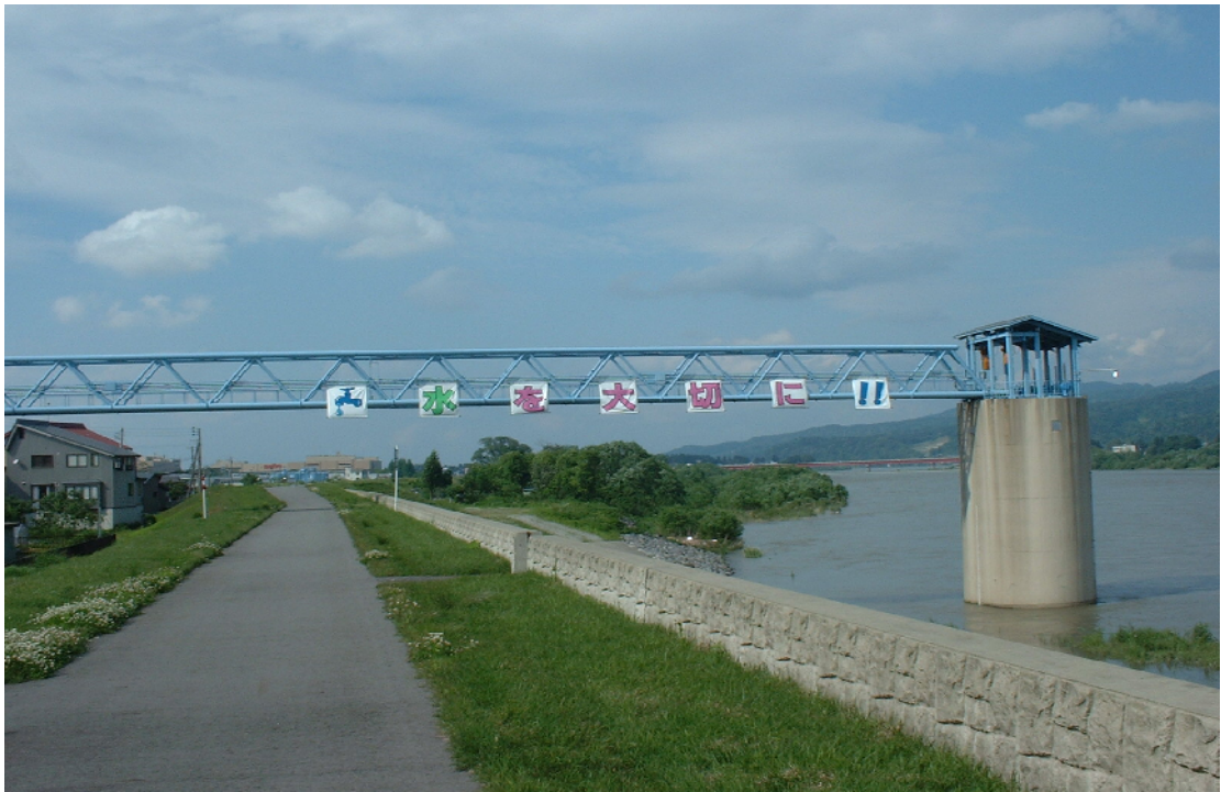
小千谷浄水場水管橋