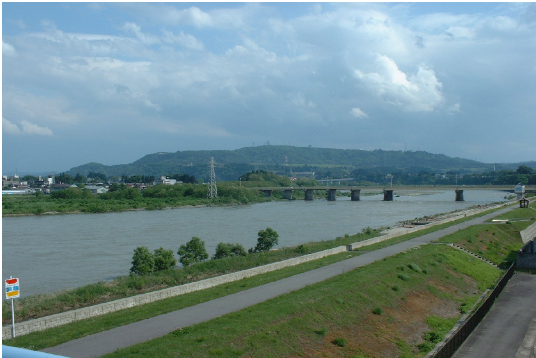
小千谷浄水場水管橋より信濃川、山本山を望む

小千谷市は、水道水の水質検査の適正化や透明性の確保のため、法令に基づき地域性を踏まえた水質検査を実施しておりますが、このたび、平成26年度の水質検査計画を策定しましたので公表いたします。