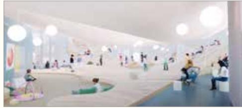
△子どもの遊び場（屋内広場）イメージ

■応募資格／どなたでも応募できます。ただし、応募用紙1枚につき1点とし、応募点数は一人3点までとします。