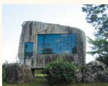
△山本山山頂の詩碑

西脇先生は、明治27年1月20日に誕生し、小千谷尋常小学校、旧制小千谷中学校に学びました。子供の頃から絵が好きで、一時は画家を目指しましたが、父親の死去により断念しました。中学生の頃から「英語屋」と呼ばれるほど英語を勉強し、慶応義塾大学に進むと、フランス語、ドイツ語、ラテン語と語学の天才ぶりをさらに発揮し、ヨーロッパ文学の豊富な知識と英語圏の人たちに負けない語学力をたずさえて、29歳でイギリス・オックスフォード大学に留学しました。その頃ヨーロッパで起きていた文学・詩の世界の大変革に大きな影響を受けて帰国。明治時代から続いていた詩の世界に新しい旋風を巻き起こし、日本における現代詩の草分けと言われる詩人になりました。昭和8年、40歳の時初めて「Ambarvalia」（穀物祭）という日本語の詩集を出し、以後86歳になるまで13の詩集を出しました。