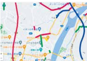
△ホームページに掲載した地図

小千谷市の情報メールを登録しているが、大雪で通行止めが発生しているときに「県道山谷片貝線の一部」などの文字だけでなく、地図も一緒に見れるとわかりやすく助かる。