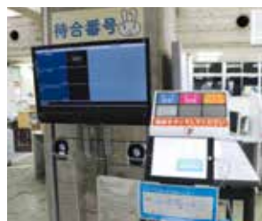
△市民ホールに導入した発券機

市民ホールへの発券機の導入により、待ち時間を見える化し、外出できるようにしました。また、対応できる職員を増やしたり、市民ホールのレイアウトを変更したりしました。