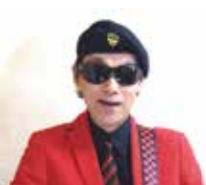
あさひのぼる (ギター漫談)