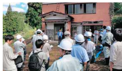
△住家の被害認定調査実地研修会の様子(平成25年10月)