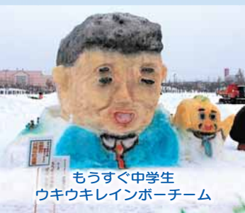
もうすぐ中学生 ウキウクレインボーズ