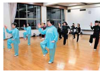
△独特な音楽に合わせて体を動かします。

——主な活動を教えてください 市内3か所で開催しています (▽小千谷小学校・月・木曜日の午後7時30分▽総合体育館・火曜日の午前9時▽ホットプラザ・火曜日の午後7時30分) 主に「簡化二十四式」と言われる健康運動としての太極拳を音楽に合わせて行っています。 ——太極拳を始めたきっかけは 何ですか 太極拳は中国から伝わったもので、ゆっくりとした動きをする