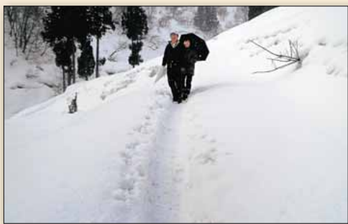
△踏み固められた雪道を登っていくと、登山中のご夫婦に会いました。城山には年間を通じてご夫婦でおいでになる方が増えています。