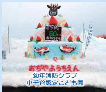
おがやふらちえん 幼年消防クラブ 小千谷認定こども園