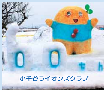
小千谷ライオンズクラブ