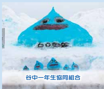
谷中一年生協同組合