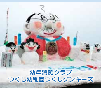
幼年消防クラブ つくし幼稚園つくしゲンキーズ