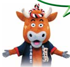
＜おぢやイメージキャラクター「よし太くん」＞