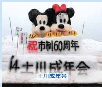
祝市制60周年 14土川成年会 土川成年会