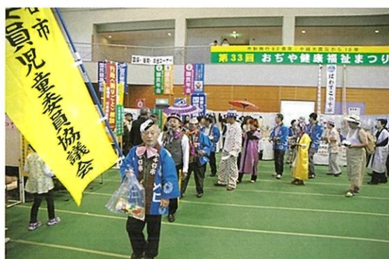
(おぢや健康福祉まつり PR活動の様子)

小千谷市民生委員児童委員協議会 (事務局) 小千谷市 福祉課 生活福祉係 電話 0258-83-3517