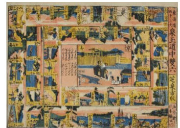
東海道五十三次 泉玉道中双六

本件に関するお問合せ先／小千谷市教育委員会生涯学習課社会教育係 担当／白井・大淵(和) TEL：0258-82-9111 FAX：0258-82-9112 E-mail：syougai-sk@city.ojiya.niigata.jp