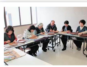
△和やかな雰囲気の中で作業を行っていました。

会員のみなさんは、おしゃべりしながら楽しそうに彫っていて、終始和やかな雰囲気でした。手先を使う細かい作業のため、脳の活性化にもよいのではないかと思います。また作品は実生活にも使えるので、趣味と実益を兼ねた活動ができそうです。