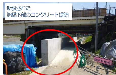
新設された旭橋下部のコンクリート堤防