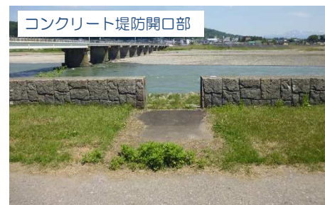
コンクリート堤防開口部