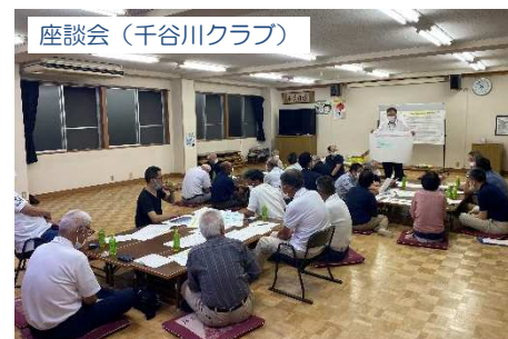
座談会(千谷川クラブ)