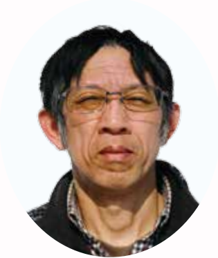
△消防団員永年勤続 (25年以上)