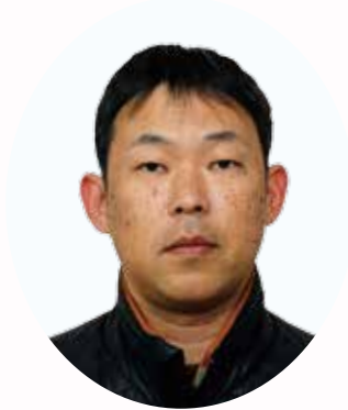
△消防団員永年勤続 (25年以上)