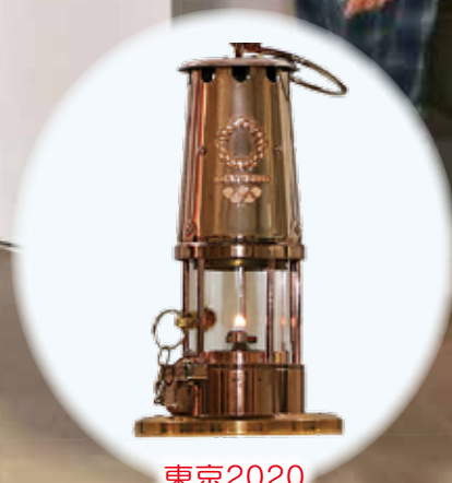
東京2020 オリンピック聖火

昨年3月にギリシャのアテネで採火された東京2020オリンピック聖火が県内巡回として、総合体育館で展示されました。当日は開場前からおおぜいの方が列を作り、この日だけで約1,800の方が来場されました。聖火リレーで使用されるトーチは触ることもでき、さまざまなポーズで記念撮影をしていました。