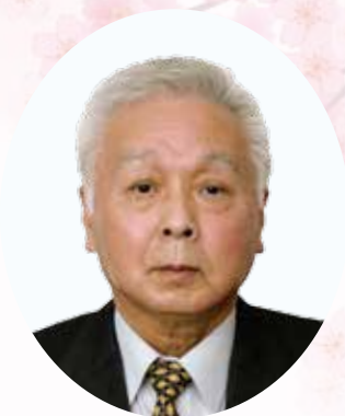
△町内会長永年勤続 (10年以上)