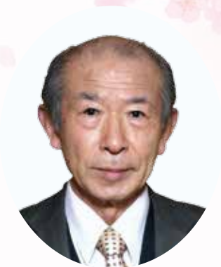
△町内会長永年勤続 (10年以上)