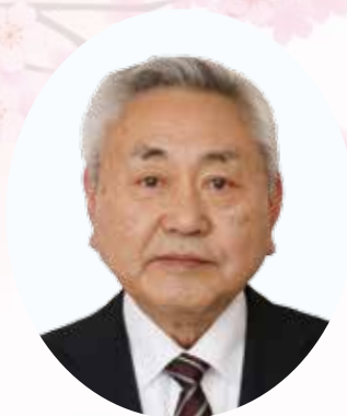
△民生委員・児童委員 永年勤続 (12年以上)

小千谷市が誕生して67年目にあたる3月10日(水)、市政に貢献された9人1団体の方々を小千谷市褒賞条例に基づいて表彰しました。受賞者の方々を紹介いたします。(敬称略) 問い合わせ／企画政策課秘書広報係 ☎ 83・3507