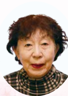
△公益のために私財 を寄附