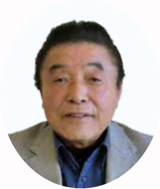
△各種委員永年勤続 (15年以上)