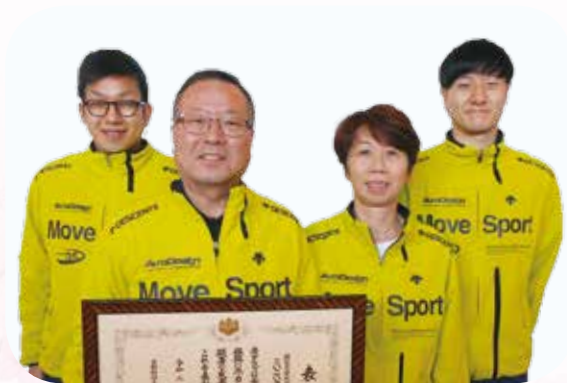
△県以上の表彰を受賞