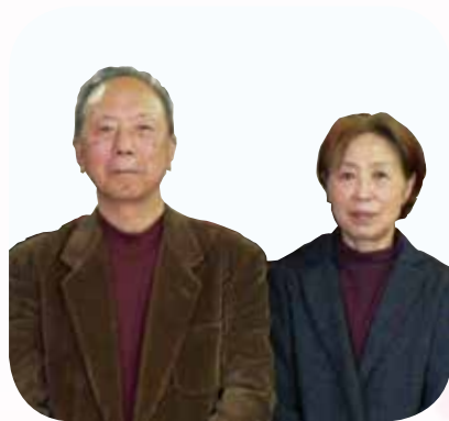
△公益のために私財 を寄附