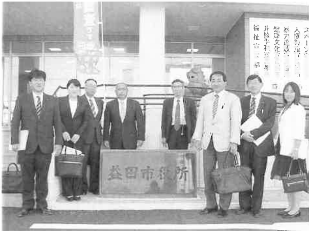
総務文教委員会行政視察