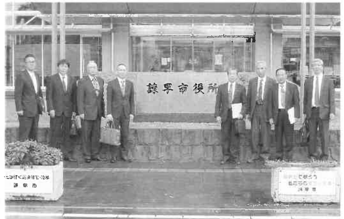
民生産業委員会行政視察