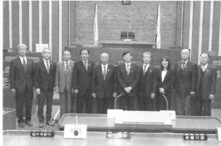
議会運営委員会行政視察