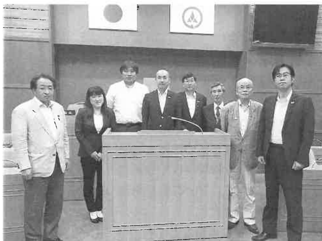
総務文教委員会行政視察