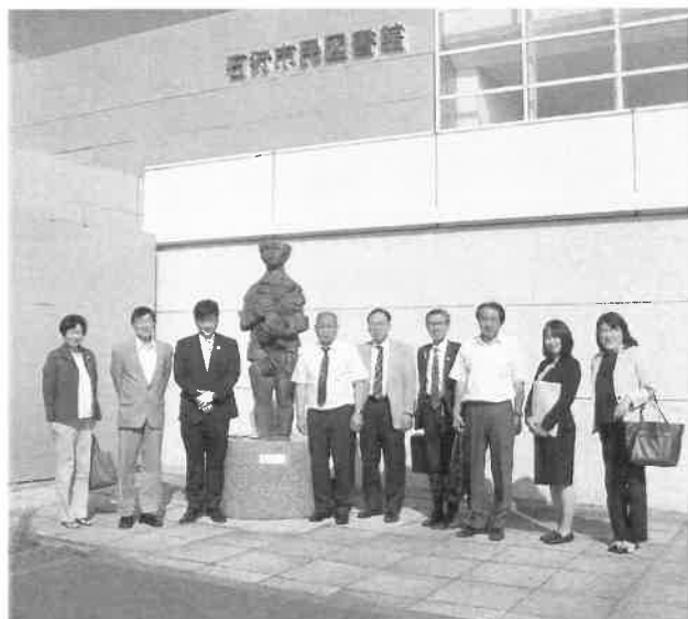
総務文教委員会行政視察