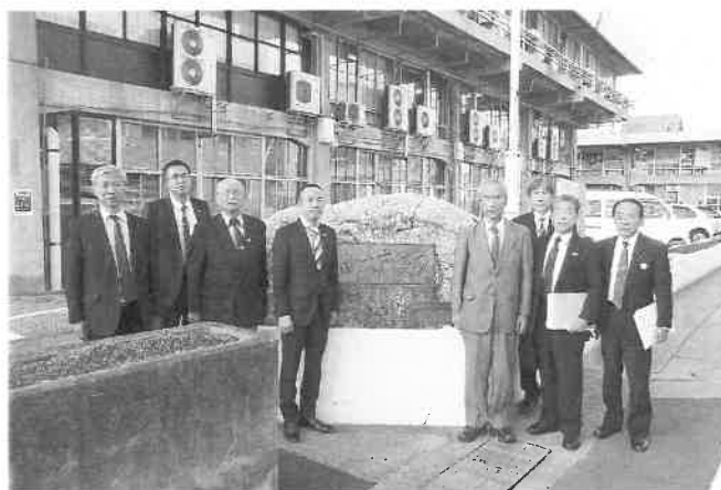
民生産業委員会行政視察