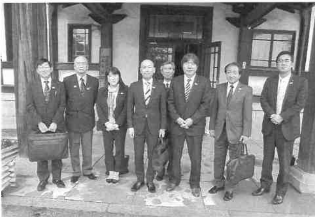
総務文教委員会行政視察