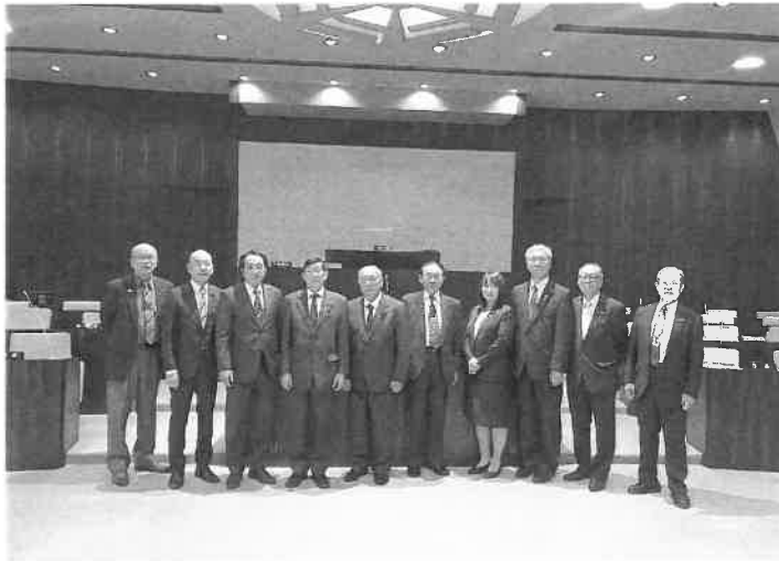
議会運営委員会行政視察