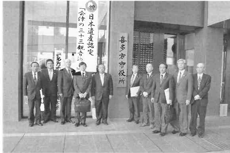
議会運営委員会行政視察