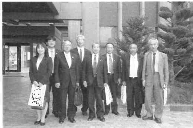
民生産業委員会行政視察