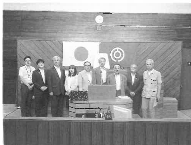
民生産業委員会行政視察