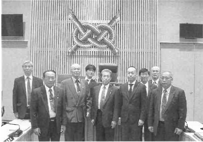
議会運営委員会行政視察