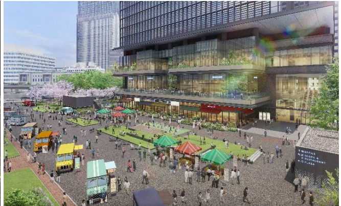
▲全体開業時の街区全体イメージパース／東京駅丸の内側より