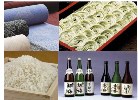
▲小千谷市特産品イメージ

・「錦鯉」が泳ぐ池を含む「小千谷市PRゾーン」（約230㎡）を活用した錦鯉飼育セミナーや即売会、品評会の実施等を通し、「錦鯉」に関する魅力や情報の発信、農産物、米菓、日本酒といった同市の特産品をプロモーションする機会を創出。