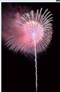
▽真人(旧真人小学校東側河川敷)

8月1日19時(午後7時)19分より、COVID-19(新型コロナウイルス)の退散を願う花火を打ち上げました。これは、おぢや産花火打ち上げプロジェクトの1つで、市内4か所で花火を19発ずつ打ち上げました。