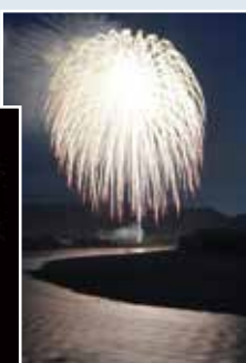
△川井新田(川井本田集会所裏河川敷)