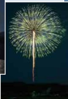
▽東栄(信濃川河川敷)