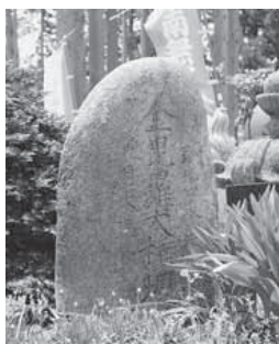
△海上交通の神様がまつられている金毘羅塔