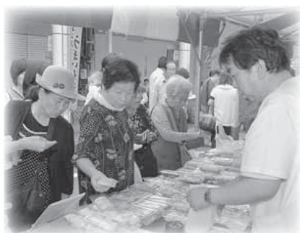
△昨年の会場の様子