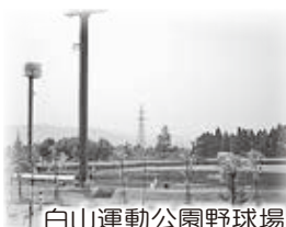
白山運動公園野球場