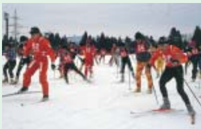
東小千谷中学校プール改築事業（新規） （H14繰越） . . . . . （9,888万円）