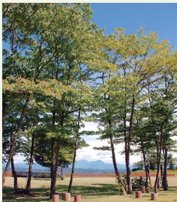
クラインガルテンふれあいの里