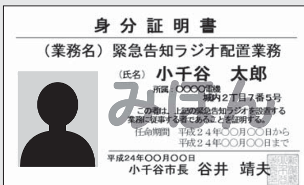
△配置する作業員が携行する身分証明書

配置作業が近くなりましたら、事前に文書でお知らせしますので、ご理解とご協力をお願いします。