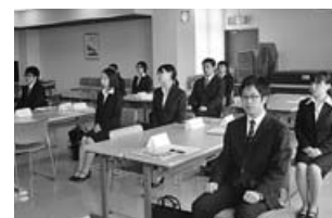
△前回実施時の様子