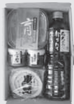
味彩 — あじさい —