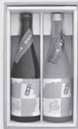
蔵あわせ 縮ラベル