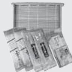
小千谷そば通だより