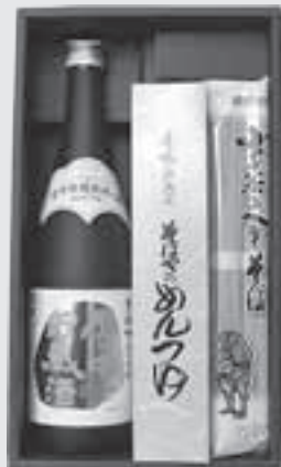
おぢやれ夢セット2011（春・夏）

おぢやファンクラブでは、この夏も小千谷の美味しい品々を取り揃え、多くの市民のみなさんから全国へ発信していただけるよう各種夏のおすすめギフトをご用意させていただいています。