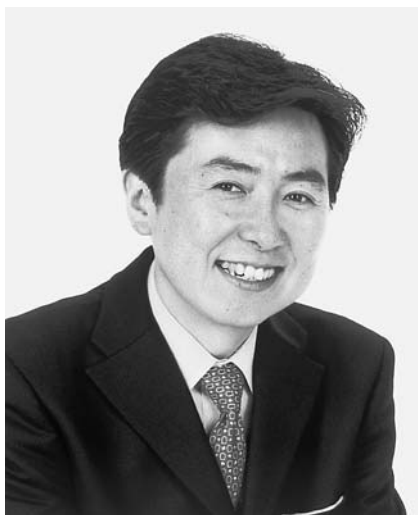
講師／笠井信輔さん

プロフィール／1963年東京都杉並区生まれ。1987年早稲田大学卒業後、フジテレビ入社。現在、編成制作局アナウンサー室在室。「タイム3（スリー）」をはじめとしたワイドショーや「今夜は好奇心」「ザ・ウィーク」「めざましテレビ」といった情報番組を担当後、夕方6時のニュース番組「ザ・ヒューマン」のキャスターを務め、「ナイスデイ」の司会を経て、現在は朝8時、月曜日から金曜日まで「とくダネ！」の司会と幅広く活躍中。奥さまはテレビ東京アナウンサーで、現在は同局報道局勤務。