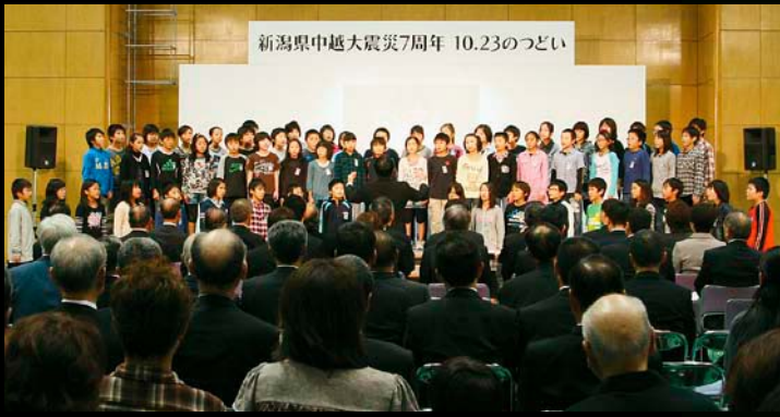
△東小千谷小学校5年生による合唱