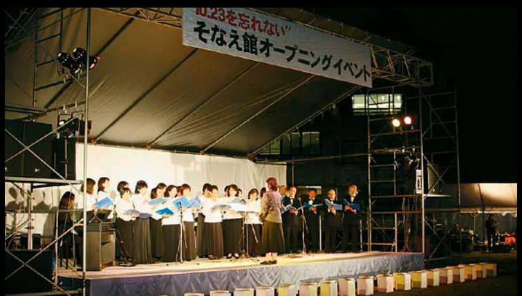
△市内混声合唱団OSCのみなさんの合唱

楽集館屋外では、中越大震災発生 の時刻に合わせ「おぢや10・23 のつどい」が開催されました。市 内の園児による絵が描かれた灯ろ うが灯る中、会場に設けられた献 花台には、雨の降る中、おおぜい の方が訪れました。ステージでは、 市内混声合唱団による合唱やレイ ンブックによる追悼コンサートも 行われました。 また当日は、中越大震災の教訓・ 体験を基にした体験型防災学習施 設「そなえ館」がオープンしまし た。地震発生から3時間後、3日 後、3か月後、3年後をテーマに した展示や地震を疑似体験できる 地震動シミュレーターなどがあり、 多くの市民が訪れていました。