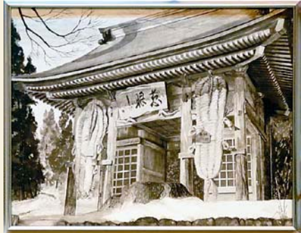
水墨画の部／新保正文さんの作品「山門の大わらじ」