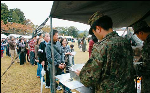
△当時のように、自衛隊の炊き出しに長蛇の列