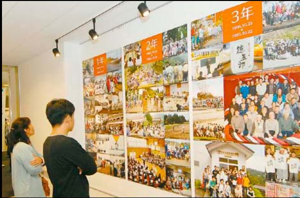
△「そなえ館」の展示写真に見入る来館者