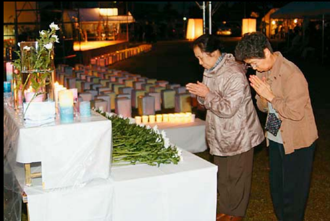
△献花台に黙とうする市民