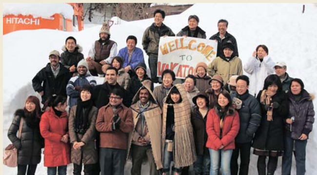
△人間として大切なことは、日本人も外国の方も同じですね (若橋を研修で訪れた JICA 研修生と地元のみなさん)