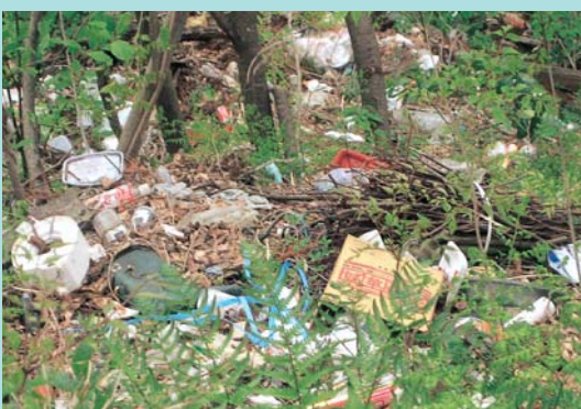
不法投棄現場の様子

不法投棄は犯罪です。法律により5年以下の懲役や1000万円以下の罰金となります。