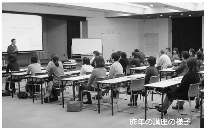
昨年の講座の様子