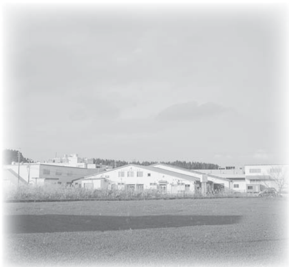
第一工業団地を南側から望む

3512 kanko@city.ojya.niigata.jp ■申込・問い合わせ／商工観光課商工振興係 83