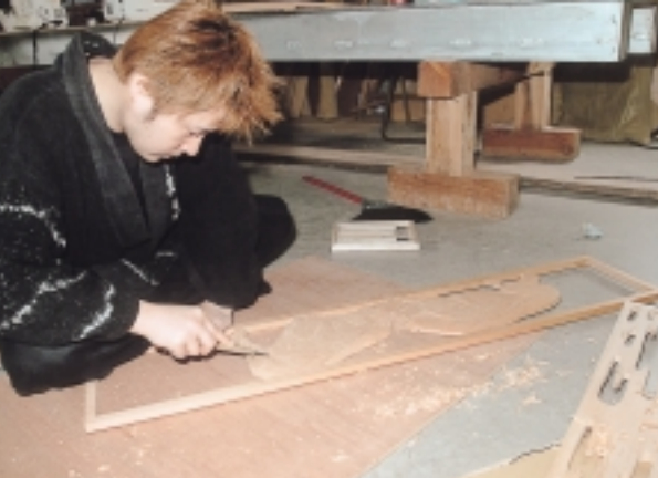
闘牛を描いた欄間を彫る会員