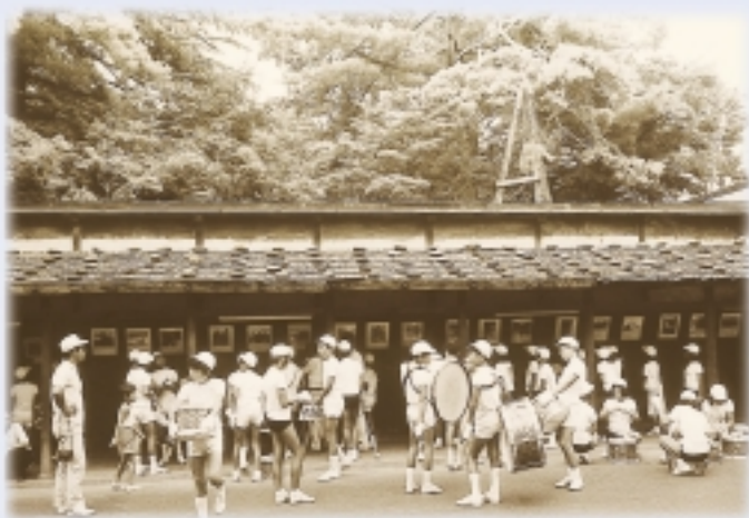
「鼓笛隊準備中」後ろの塀には全日本写真連盟小千谷支部の写真展