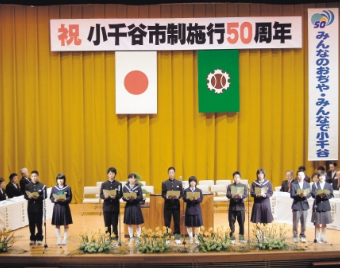
市民の願いを朗読する市内各中学校の代表生徒

小千谷市制施行50周年記念式典が5月12日(水)市民会館で開かれました。小千谷市は昭和29年3月に県内8番目の市として誕生しました。式典の中で関市長は「素晴らしい自然を生かし、農村と都市が交流し、食文化を重視した循環持続型のまちづくりを推進したい」と述べました。式典ではこれまで市政に功労のあった方がたが表彰されました。