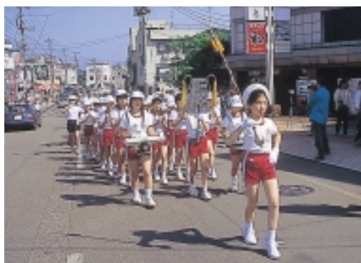
式典に先立って行われた鼓笛隊パレード