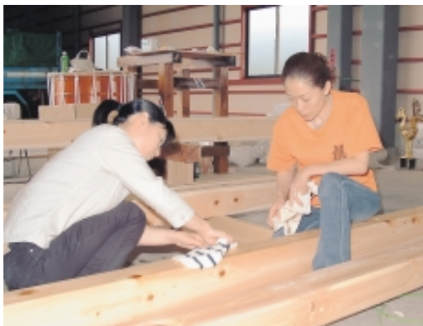
担ぎ棒を身が磨く女性会員

申込・問い合わせ / 夢人会事務局佐藤 ☎090-3473-5006または小千谷新聞社☎ 82-2378 夢人会ホームページ http://www15.ocn.ne.jp/mujinkai/ メールアドレス mujinkai@herb.ocn.ne.jp