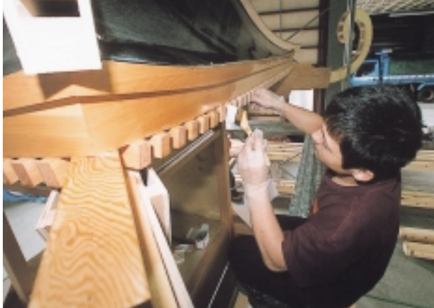
みこしの天井に汚れ止めを塗る作業