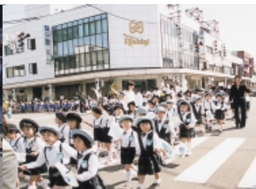
保育園、幼稚園児もパレードに参加