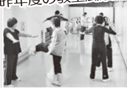
昨年度の教室風景