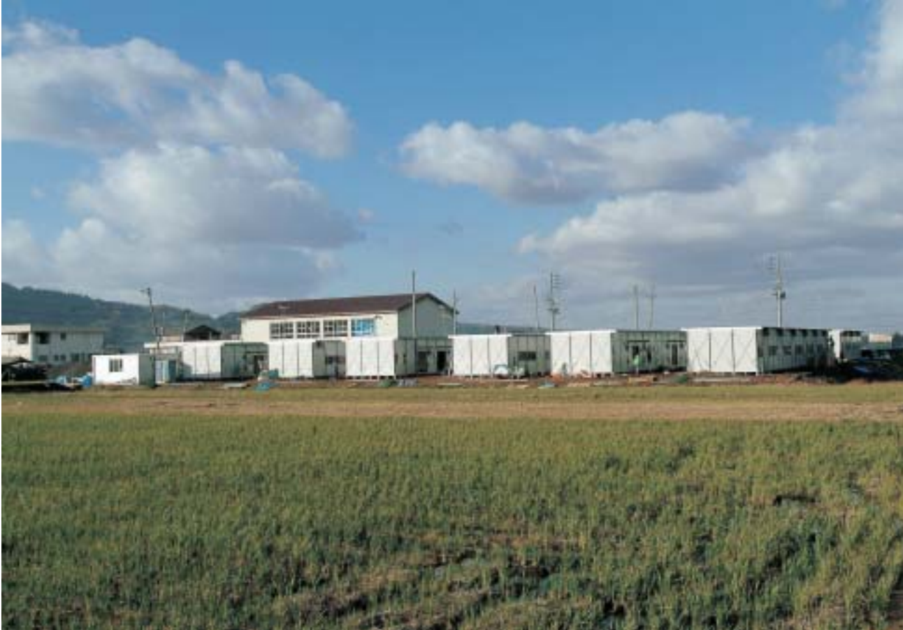
吉谷トレーニングセンター敷地内に建設が進む応急仮設住宅（第2次募集分）

新潟県中越大地震が発生してから、既に1カ月半が経過をいたしました。まだ、避難生活を余儀なくされている方が多く、市としても現在復旧に向け全力で取り組んでおります。