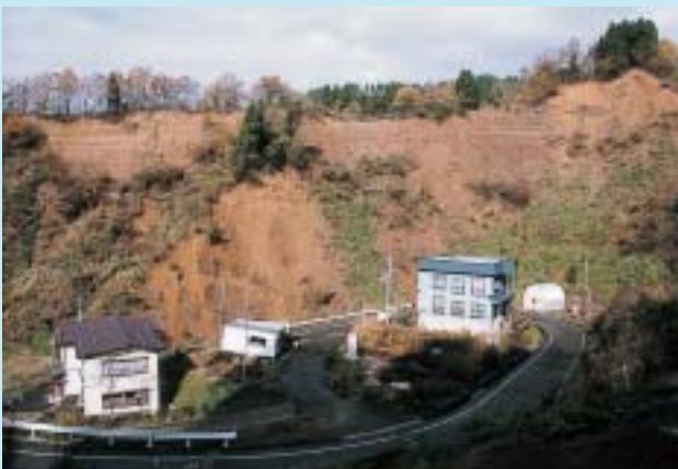
崖崩れによりあたりが一変した首沢付近