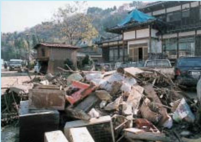
泥まみれになった家具類(浦柄)