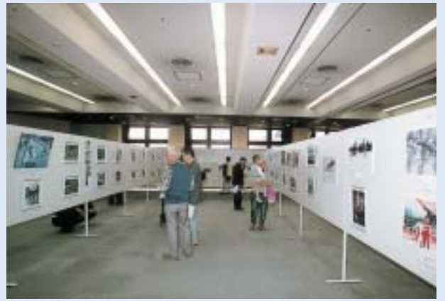
市制施行50周年記念思い出の写真展・小千谷の祭り写真展開催