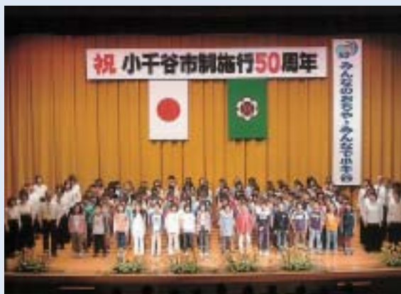
市制施行50周年記念式典開催