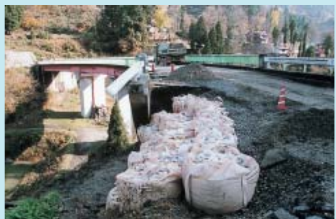
橋のたもとがくずれ落ちた蘭木トンネル