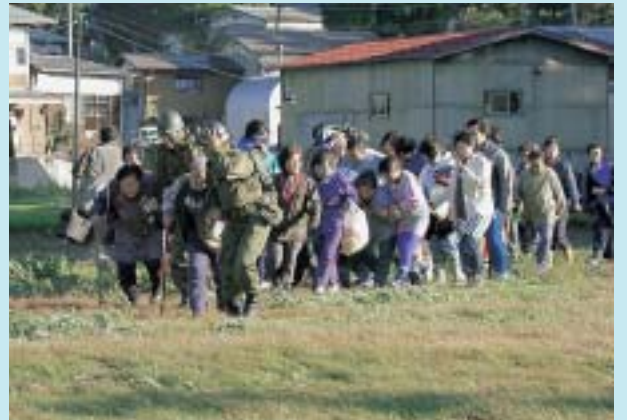
自衛隊のヘリで救助される人たち(塩谷)