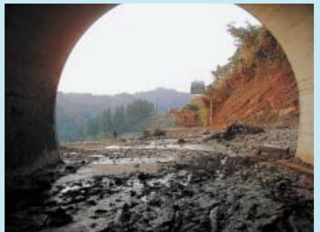
一時土砂に埋まった塩谷トンネル