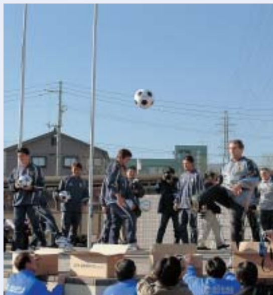
サッカーのジーコジャパンドリームチーム 総合体育館避難所を激励(12月3日)