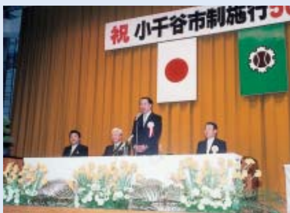
東京都杉並区と災害時相互援助協定を締結