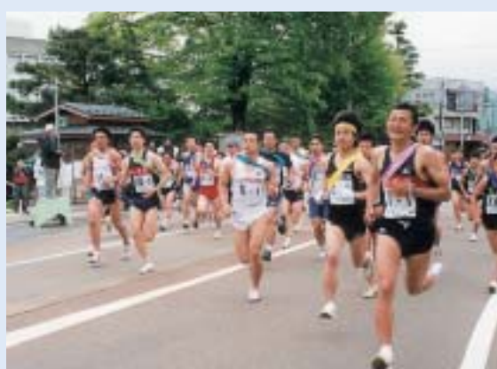
市制施行50周年記念市民駅伝競走大会

2004年は小千谷市にとっては市制施行50周年の記念すべき年でありましたが、10月23日(土)に起きた新潟県中越大地震より一転し、大変な年となってしまいました。