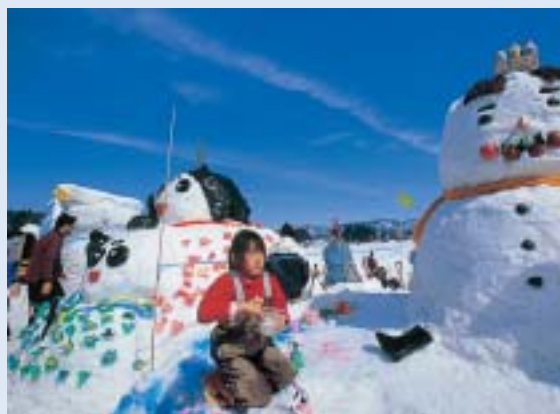
おぢや風船一揆で「雪だるま50コンテスト」