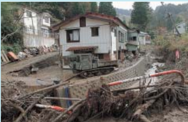
川があふれ泥がたまった荷頃