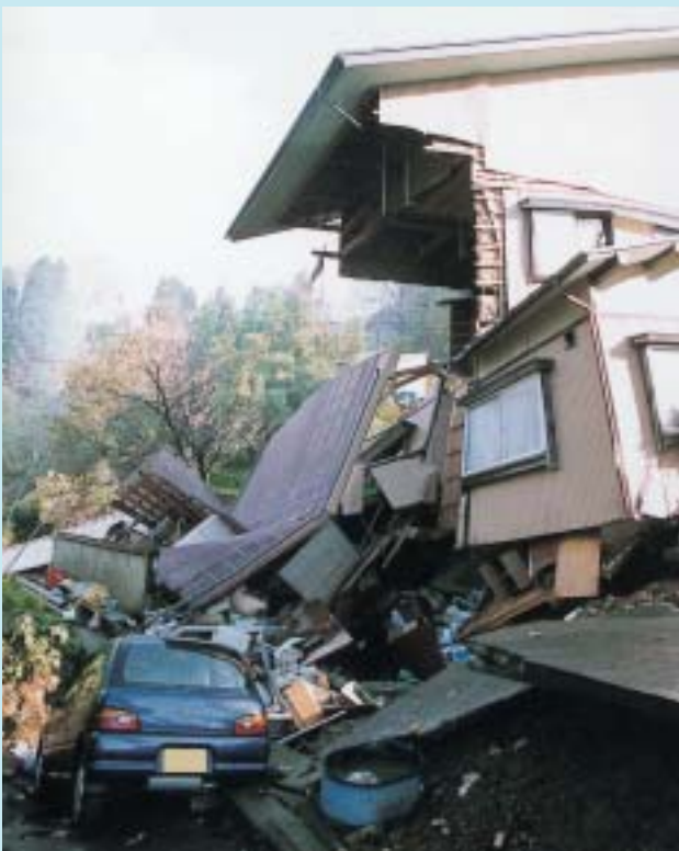
家財が飛び出した家（中山）