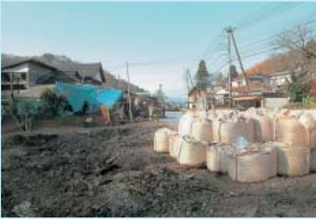
土のうが積まれた浦柄