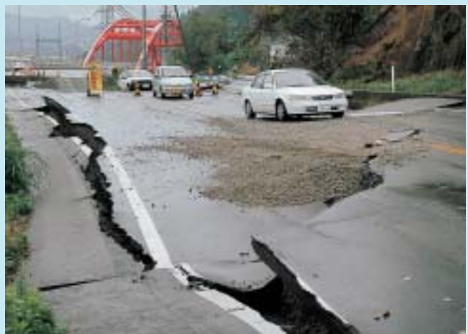
道路に段差とひび割れができた山辺橋付近