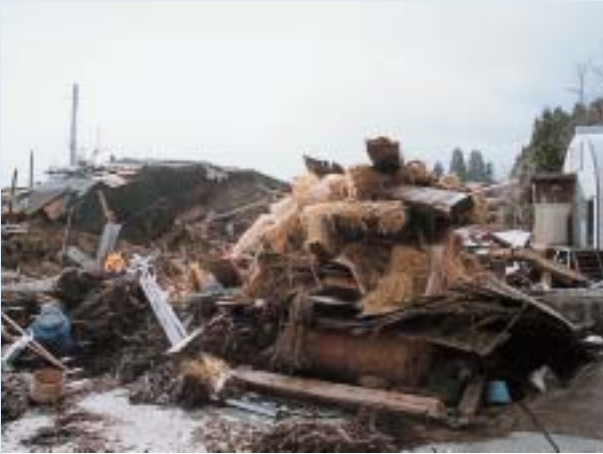
新潟県中越大震災発生