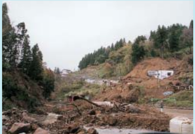
土砂であふれる東山トンネルと道路