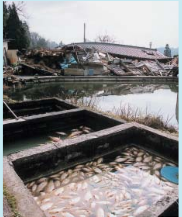
倒壊した家屋と死んだ錦鯉(塩谷)