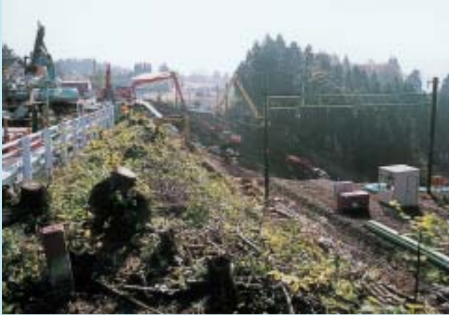
線路が見えないほどの被害があった上越線 (小千谷ー川口間)