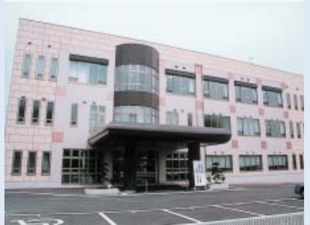
小千谷市片貝総合センターオープン