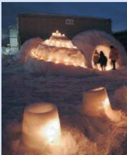
復興の灯ミニかまくら (1月23日(日)千谷急急仮設住宅)

小千谷市役所 ☎ 83・3511(代) http://www.city.ojiya.niigata.jp/