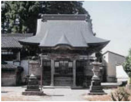
片貝町一之町にある観音寺

これは現在は無住となっている片貝町一之町にある観音寺の祭礼について書かれたもので、片貝花火の起源ともいべき事柄について記されているが、今回はこれが目的ではなく観音寺について触れてみたい。かつて浅田壮太郎先生も