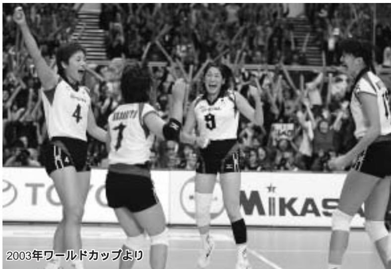
2003年ワールドカップより

2008年北京五輪に向けて、結成されたばかりの柳本晶一監督率いる“ニュー柳本ジャパン”メンバーがやってきます！