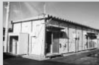
元中子応急仮設住宅