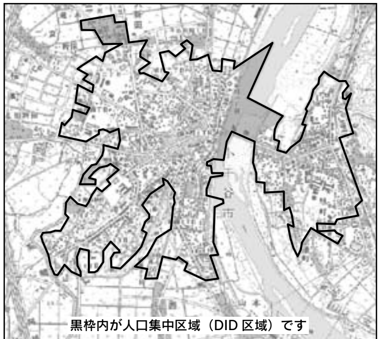
黒枠内が人口集中区域（DID区域）です